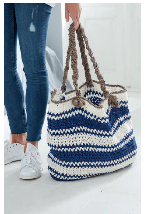
SEA-BYLLE BEACH BAG S10558 | Webdesign