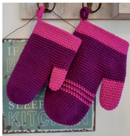
DANI OFENHANDSCHUH S11057 | Booklet Catania Grande Topflappen