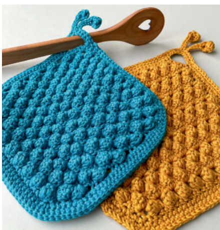
RALPH TOPFLAPPEN S11056 | Booklet Catania Grande Topflappen

29 Farben Colors Coloris Kleuren Färger Farger R 03105 2 03106 1 03110 1 03114 4 03115 3 03128 4 03164 5 03205 6 03207 5 03208 4 03209 6 03210 3 03211 3 03212 2 03213 3 03230 3 03242 1 03248 2 03249 6 03252 3 03254 2 03282 4 03284 5 03380 4 03383 5 03385 5 03392 6 03393 1 03406 2